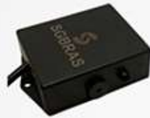
LEITOR RFID COM LED