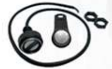
LEITOR IBUTTON SEM CAIXINHA