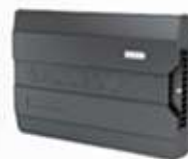
RASTREADOR GALILEOSKY 7XLTE