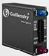
RASTREADOR GALILEOSKY BASE BLOCK IRIDIUM