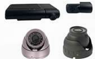
SENSOR DE FADIGA SF04A