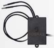
SENSOR DE TEMPERATURA POR SONDA