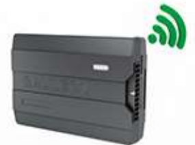
RASTREADOR GALILEOSKY 7XLTE HUB WI-FI