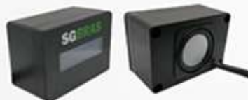
AUXILIAR DE BORDO INTEGRADO (VISUAL + VOZ)