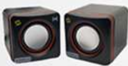
AUXILIAR DE BORDO POR VOZ