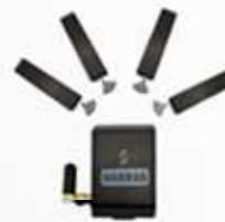
BLOQUEADOR INTELIGENTE SW403