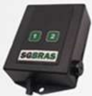
LEITOR RFID COM 2 BOTÕES