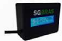
AUXILIAR DE BORDO