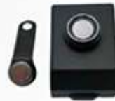
LEITOR IBUTTON COM CAIXINHA