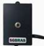
SENSOR DE TEMPERATURA POR INFRAVERMELHO